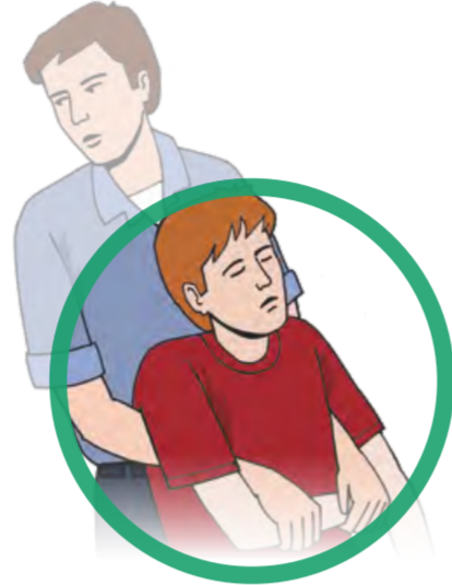
Person ggf. aus dem Gefahrenbereich retten